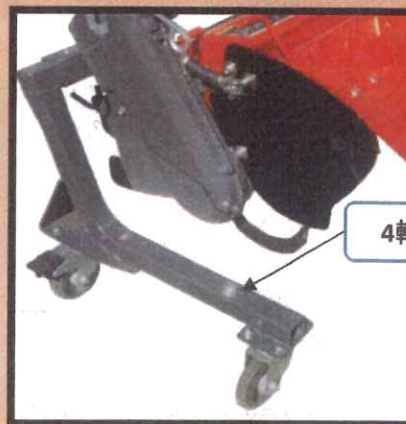
4輪キャストスタンド

4輪キャストスタンドを装着することで収納やトラクタ脱着時の移動が容易に行えます。